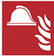
Neue Kennzeichnung („Mittel und Geräte zur Brandbekämpfung“)